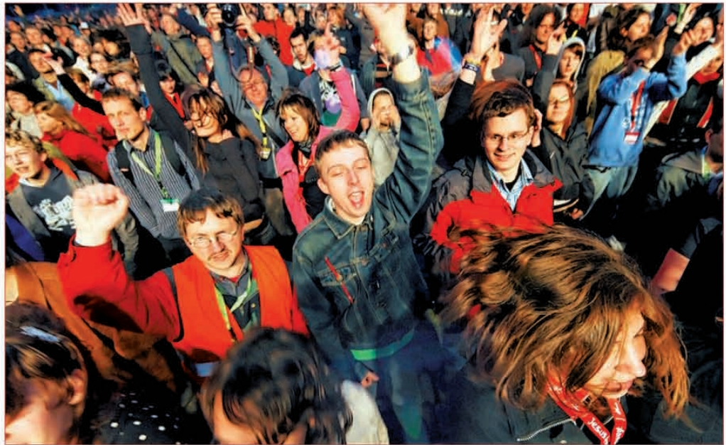
Fröhliche Christen beim Christival in Bremen – dessen Bekehrungsseminare sogar Schirmherrin von der Leyen aufstießen.

Christliche Bands rockten bis spät in die Nacht. Tagsüber machten sich Gruppen auf den Weg, um an Haustüren zu klingeln und Gottes Wort zu verkünden. In Straßenbahnen wurde per Lautsprecher Mission betrieben. Auch an Prominenz mangelte es nicht. Als Schirmherrin fungierte Bundesfamilienministerin Ursula von der Leyen (CDU) – als Anerkennung der christlichen Kinder- und Jugendarbeit und zur Stärkung der jungen Menschen. Bischof Wolfgang Huber beehrte eine Messe, Bremens Exbürgermeister Hen-